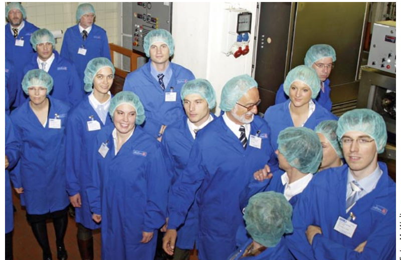
Logistik live in Keksuniform: Besichtigung der Süßgebäckproduktion von Bahlsen.

Die optimierten Rüstzeiten hatten direkten Einfluss auf die produzierten Bestände. Vor zehn Jahren verfügte Bahlsen pro Produkt durchschnittlich über Warenbestände, die