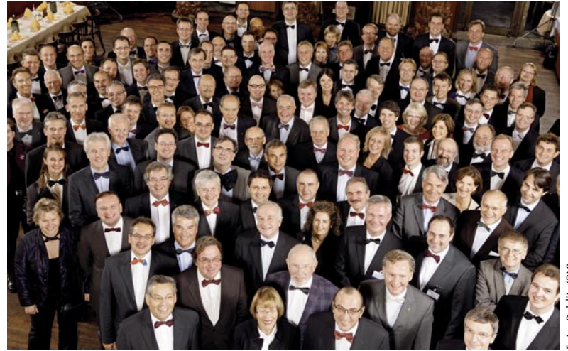
Vielflieger-Treffen in Berlin

Ein paar Kilometer weiter feierte der Osnabrücker Logistikdienstleister Hellmann. Dieser lud seine Kunden und Geschäftspartner in den Berliner 20er-Jahre-Club Queens 45bc. Gastredner war der Priester und ehemalige Benediktinermönch