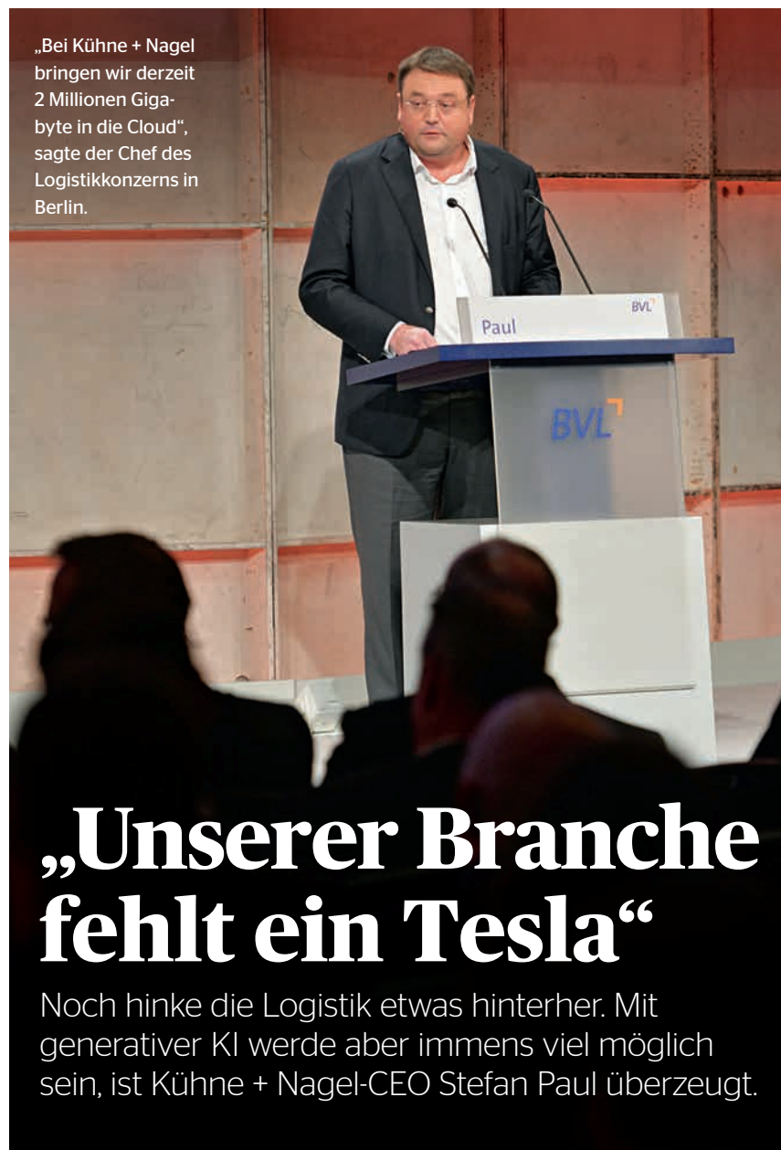
„Bei Kühne + Nagel bringen wir derzeit 2 Millionen Gigabyte in die Cloud“, sagte der Chef des Logistik Konzerns in Berlin.

„Der logistische E-Motor funktioniert nur in einer vollständig digitalen Wirtschaft, in der nicht nur die Werkzeuge digitalisiert sind, sondern in der die Daten, Strukturen und Prozesse komplett transformiert sind“, sagte Paul weiter. Mit Blick auf seine Branche stellte er fest: „Wir haben digitale Werkzeuge, sind aber noch nicht gut genug in der Transformation. Wir können heute alle mehr oder weniger die zig Touchpoints einer See-, Luft- oder Landfracht managen. Aber zu oft geschieht das noch in