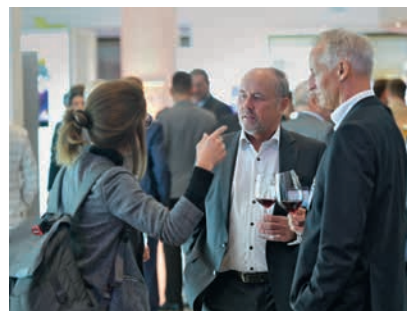
Die Inhalte des Tages sorgen noch lange für Gesprächsstoff.