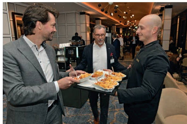
Must-have beim After-Work-Hangout: eine Berliner Currywurst.

Doch nun ist es Zeit aufzubrechen. Tschüss und Danke für alles, Interconti! Hallo Estrel. Alle sind gespannt und freuen sich, eine neue Ära einzuläuten. Mit neuem Konzept, in anderen Räumen und modernem Mindset. (rok)